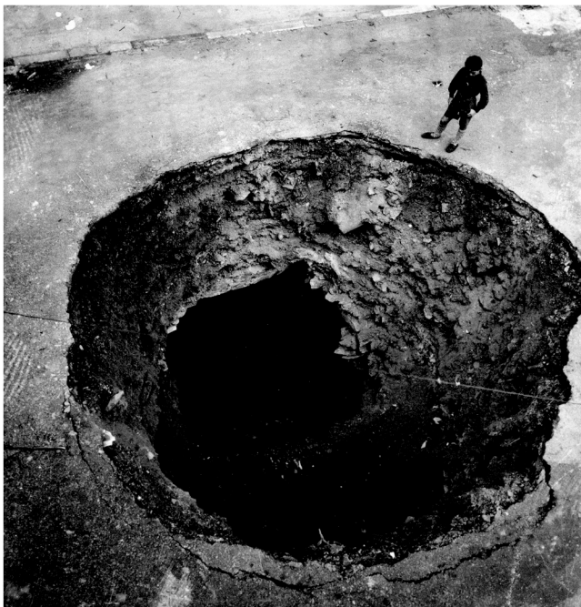
Bonbak babeslekuan eragindako zuloa